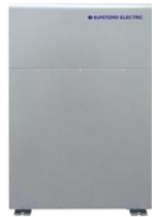
パワコン・蓄電池一体型